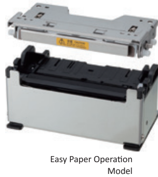
Easy Paper Operation Model